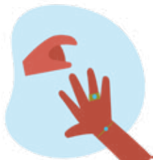
Figura 4. Como calçar e remover luvas de Proteção

Remova jóias e outros artefactos das mãos e pulsos