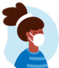
Máscara cirúrgica descartável