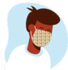
Máscara de tecido